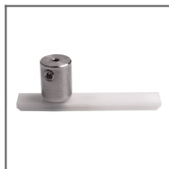
Zawieszka MULTI Ref: 00214