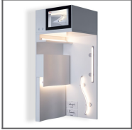
Plansza P230-90083M Ref: 90083M