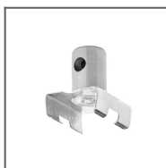
Głowica ZO Ref: 42217