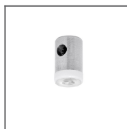
Głowica BZP-ZO Ref: 42214