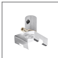
Głowica 45-ZZ Ref: 42212