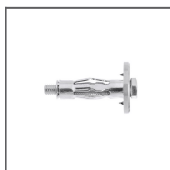
Mocowanie C3 Ref: 42105