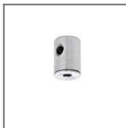
Głowica BZP Ref: 42213