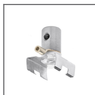
Głowica ZZ Ref: 42218