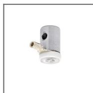
Głowica BZP-ZZ Ref: 42215