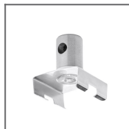
Głowica 45-ZO Ref: 42211