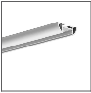
Profil TOST Ref: B5393