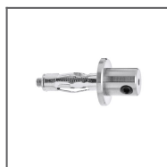
Mocowanie C6 Ref: 42108