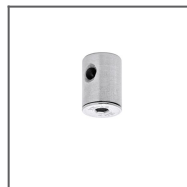
Głowica BZP Ref: 42213